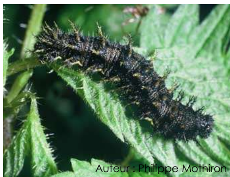
Auteur : Philippe Mothiron

Sa taille varie entre 35 et 40 mm au dernier stade. Elle est noire avec de petits points blancs et possède des épines noires ramifiées. Cependant, les chenilles de cette espèce sont très variables, certains spécimens sont verts ou grisâtres.