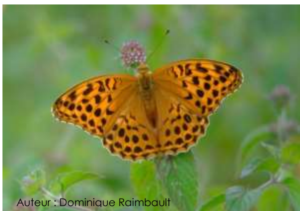
Auteur : Dominique Rimbault

Sa taille varie entre 55 et 65 mm. Ce grand papillon est de couleur fauve orangé avec des taches noirs. Chez le mâle, on peut également observer des stries noires caractéristiques au niveau des ailes antérieures. La femelle est plus terne et a des taches noires plus arrondies. Le dessous des ailes antérieures est identique au dessus, avec un apex verdâtre. Le revers des ailes postérieures est verdâtre avec des bandes transversales blanches.