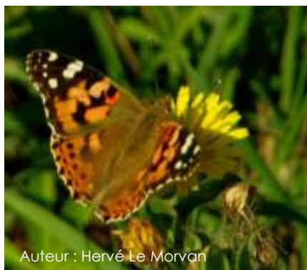
Auteur : Hervé Le Morvan

Son envergure varie entre 40 et 65 mm. La couleur du dessus des ailes varie de saumon à fauve (orangé). Le bout des ailes antérieures est noir avec quelques taches blanches, tandis que les ailes postérieures ont plusieurs rangées de points noirs. Le dessous des ailes est bariolé c'est-à-dire coloré de tons vifs et variés. On peut voir notamment du beige, du noir et du blanc avec des teintes de rose ; mais également des ocelles dont le centre est gris voire bleu.