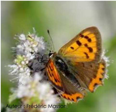
Auteur : Frédéric Masson