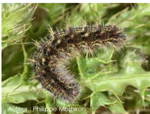
Auteur : Philippe Mothiron

La chenille mesure environ 30 mm au dernier stade. Lorsqu'elle est jeune, son corps est noir et recouvert d'épines ramifiées blanches-jaunâtre disposées sur des tubercules orangés. Lorsqu'elle est à maturité, son corps est gris verdâtre, toujours avec des épines ramifiées.