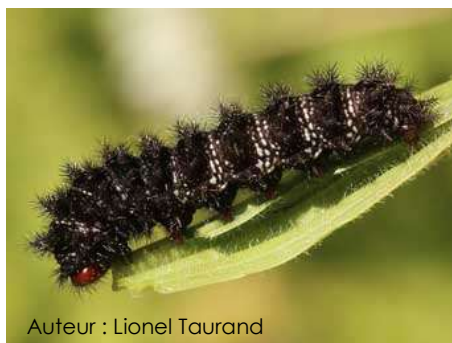
Auteur : Lionel Taurand

La chenille est noire, elle a des épines noires et une tête rouge.