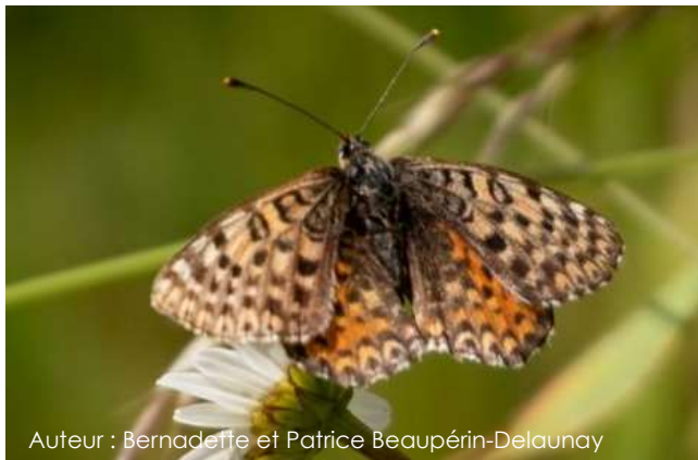
Auteur : Bernadette et Patrice Beaupérin-Delaunay

Ce papillon a une envergure comprise entre 30 et 40 mm. La face supérieure des ailes chez le mâle est de couleur fauve orangé avec des taches noires et une bordure brun-noir. La femelle est plus terne, sa couleur varie d'orange à gris, les motifs sont eux aussi plus sombres que pour le mâle. Le dessous de l'aile antérieure est orange et est bordé de blanc avec plusieurs points noirs. Le dessous de l'aile postérieure est blanc avec des rangés de taches noires (parfois en forme de tiret) et des bandes orange bordées de noir.