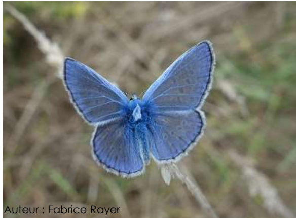
Auteur : Fabrice Rayer