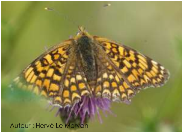
Auteur : Hervé Le Morvan