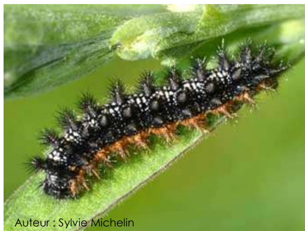
Auteur : Sylvie Michelin

La chenille est gris-noir ponctuée de petits points blancs avec des épines orangées à pointe blanche.