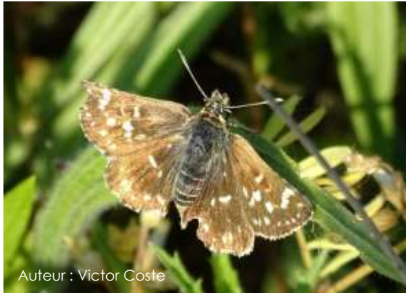
Auteur : Victor Coste