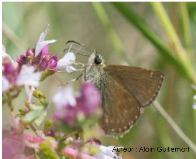
Auteur : Alain Guillemart

Son envergure varie entre 25 et 30 mm. Le dessus des ailes est brun, plus ou moins sombre, avec des bandes grises et des séries de points blancs sur les ailes antérieures et quelques petits points blancs au niveau de la bordure des ailes postérieures. Le dessous est plus clair et avec seulement quelques taches blanchâtres. La tête est large et porte des antennes séparées à la base.