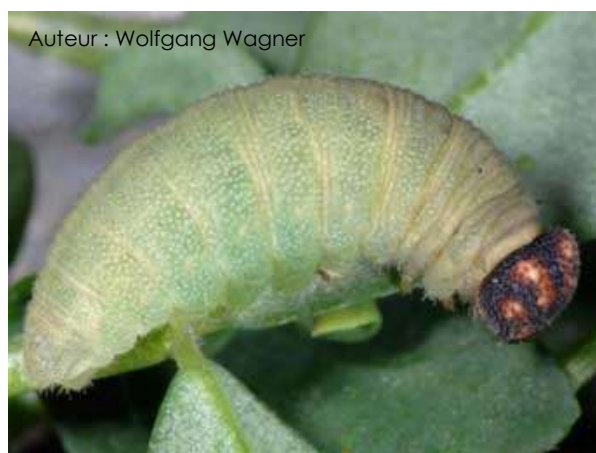
Auteur : Wolfgang Wagner

La chenille est courte et verte avec des lignes latérales blanches-jaunâtre. Sa tête est noire avec des taches rouge orangé.