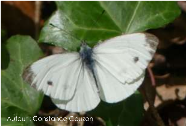
Auteur : Constance Couzon