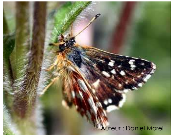
Auteur : Daniel Morel