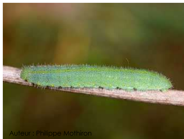
Auteur : Philippe Mothiron

La chenille mesure environ 25 mm au dernier stade. Elle est verte, couverte de fins poils et avec une ligne de petits points jaunes sur les flancs.