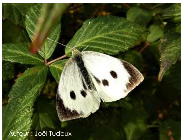
Auteur : Joël Tudoux