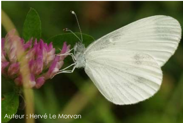
Auteur : Hervé Le Morvan