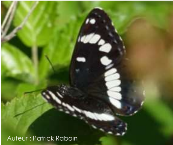
Auteur : Patrick Raboin