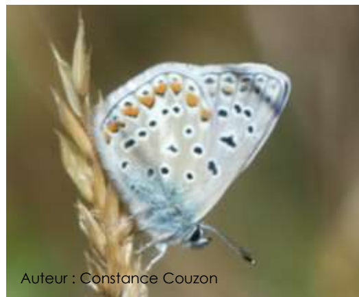
Auteur : Constance Couzon