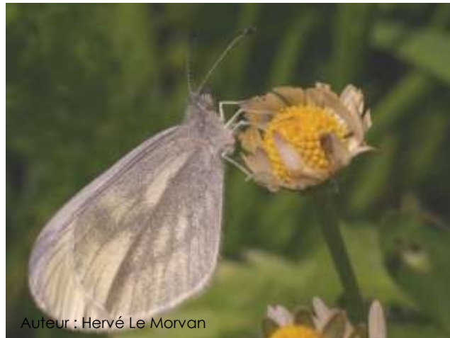
Auteur : Hervé Le Morvan

Il mesure entre 30 et 40 mm. Ce petit papillon a les ailes blanches avec une tache grise à l'apex de l'aile antérieure, plus prononcée chez le mâle. Le dessous des ailes est blanc également et présente au niveau des ailes postérieures deux nuances de gris.