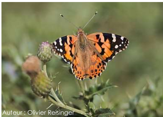
Auteur : Olivier Reisinger