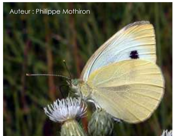
Auteur : Philippe Mothiron