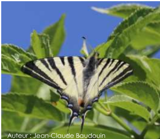
Auteur : Jean-Claude Baudouin