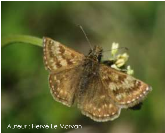
Auteur : Hervé Le Morvan