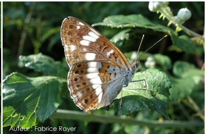
Auteur : Fabrice Rayer