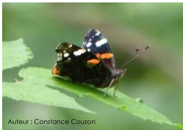
Auteur : Constance Couzon

Son envergure est comprise entre 60 et 65 mm. Le dessus des ailes est brun-noir marqué, sur les ailes antérieures, par une bande rouge et des taches blanches aux extrémités. Une bande rouge contenant des points noirs borde les ailes postérieures. Le dessous des ailes antérieures porte les mêmes motifs que le dessus mais est plus terne. Le dessous des ailes postérieures est brun foncé.