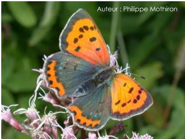
Auteur : Philippe Mothiron

Son envergure est d'environ 25 mm. Le dessus des ailes antérieures est orange vif avec plusieurs points noirs et une large bordure brune. Le dessus des ailes postérieures est brun avec une bande orange au niveau de la bordure postérieure. Le revers des ailes antérieures est identique au-dessus. Le dessous des ailes postérieures est gris avec de légers points noirs et une fine bande submarginale orange.