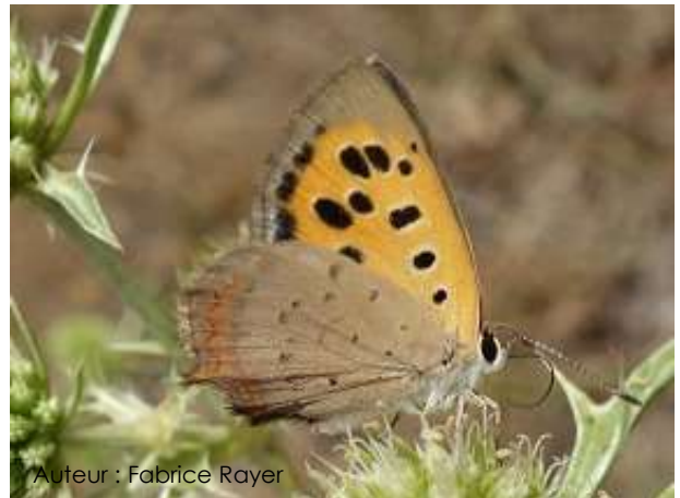
Auteur : Fabrice Rayer