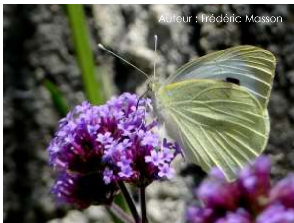
Auteur : Frédéric Masson

Sa taille est comprise entre 50 et 65 mm. Le dessus des ailes est blanc avec une tache noire à l'extrémité de l'aile antérieure. La femelle a deux taches noires au milieu des ailes antérieures, dont le mâle est dépourvu. Le dessous des ailes est jaunâtre avec deux taches noires au niveau des ailes antérieures.