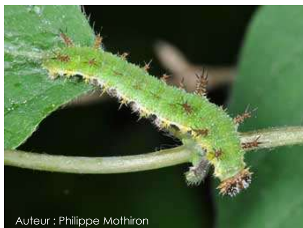
Auteur : Philippe Mothiron

La chenille est de couleur verte, elle possède une tête brune et des épines jaunâtres.