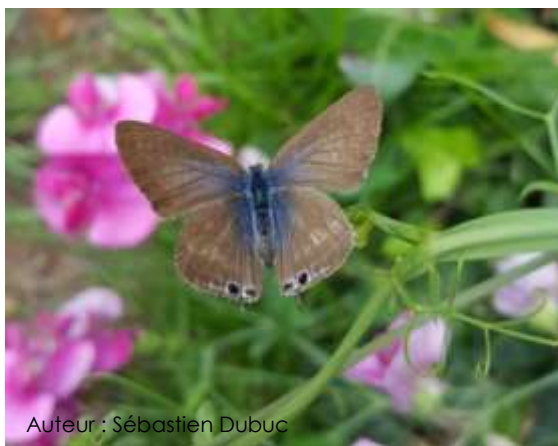
Auteur : Sébastien Dubuc