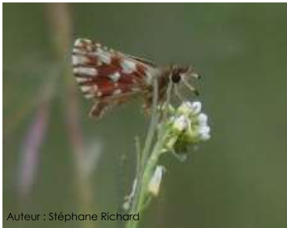
Auteur : Stéphane Richard

Son envergure est de 20 à 25 mm. Ce petit papillon est brun-noir avec des taches blanches. Le dessous des ailes postérieures est rougeâtre avec des taches blanches. Ce papillon possède des antennes largement séparées à la base.