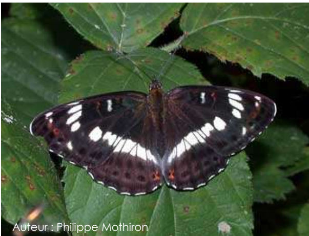
Auteur : Philippe Mothiron

Son envergure varie entre 40 et 50 mm. Ce papillon est marron foncé voire noir, avec une bande centrale blanche. Le dessous des ailes est orange avec une rangée de taches blanches et des points noirs au niveau des ailes postérieures.