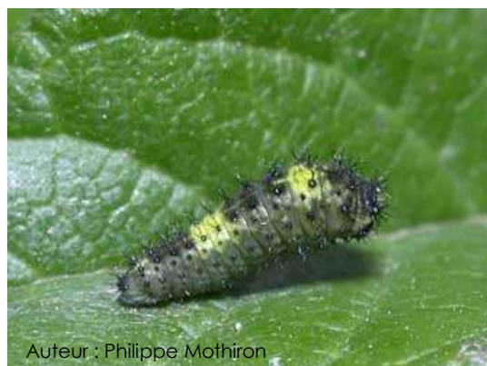
Auteur : Philippe Mothiron

La chenille mesure entre 40 et 45 mm. Elle est verte avec des stries obliques jaunes et des points rouges ou bruns. Elle possède un organe jaune orangé derrière la tête qu'elle peut sortir en cas de menace pour émettre une odeur et faire fuir les prédateurs.