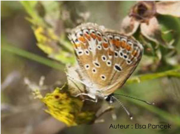
Auteur : Elsa Pancek

Son envergure est comprise entre 20 et 30 mm. La couleur de ses ailes est marron foncé, avec des taches submarginales rouge orangé. Chez le mâle, le dessous des ailes est gris ; chez la femelle, il est brun clair. On peut y voir des points noirs entourés de blancs et des taches submarginales oranges.