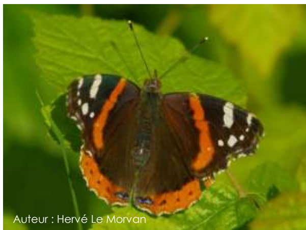
Auteur : Hervé Le Morvan