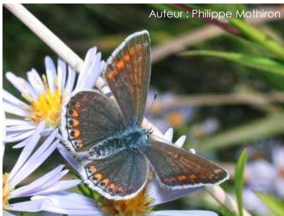
Auteur : Philippe Mothiron

Il mesure entre 20 et 30 mm. Pour les mâles, le dessus des ailes est bleu vif avec une bordure noire et des franges blanches. Le dessus des ailes des femelles est brun avec des reflets bleus (plus ou moins étendus selon les générations) et des taches orange marginales. Le dessous des ailes est identique pour les mâles et les femelles. Il est gris-brun, avec un reflet bleu à la base des ailes postérieures. On retrouve plusieurs ocelles noirs entourés de blanc et une série de taches submarginales orange.