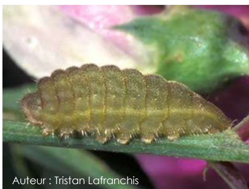
Auteur : Tristan Lafranchis

La chenille mesure 12 mm au dernier stade. Sa couleur est variable, elle peut être verte, jaune ou pourpre. Elle possède de fines lignes brunes.