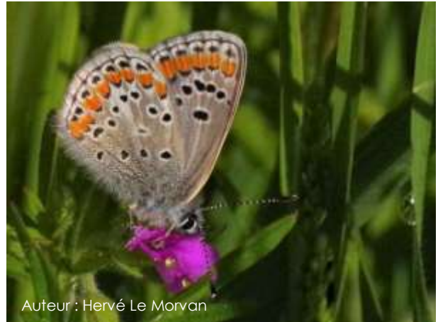
Auteur : Hervé Le Morvan