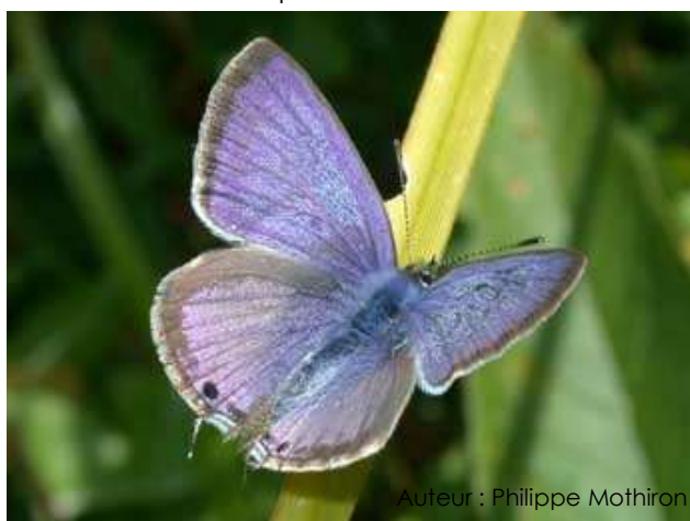
Auteur : Philippe Mothiron

Son envergure varie entre 20 et 30 mm. Le dessus des ailes du mâle est bleu violet, chez la femelle il est brun avec une présence plus ou moins marquée de bleu. Ils portent tous les deux une queue au niveau des ailes postérieures avec un point noir à la base de celle-ci. Le dessous des ailes est marbré de brun clair. Au niveau des ailes postérieures, on remarque une ligne blanche bien marquée et un ocelle noir.