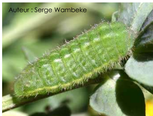
Auteur : Serge Wambeke

Elle mesure environ 13 mm au dernier stade. Elle est verte, courte, elle a des lignes jaunes sur les côtés et est couverte de poils fins.