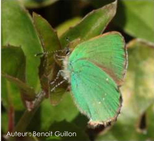
Auteur : Benoît Guillon