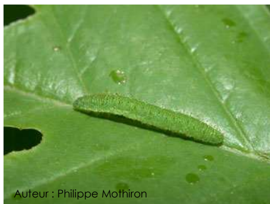
Auteur : Philippe Mothiron

La chenille mesure entre 30 et 35 mm. Elle est cylindrique, son corps est vert bleuté avec de tout petits points noirs.