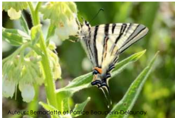
Auteur : Bernadette et Patrice Beaupérin-Delaunay

Son envergure varie entre 50 et 70 mm. Les ailes de ce grand papillon sont jaunes zébrées de lignes noires. Les ailes postérieures possèdent une tache orange à l'arrière de l'abdomen, des lunules bleues en bordure et une longue queue noire avec le bout blanc. Le dessous des ailes est identique mais plus terne.