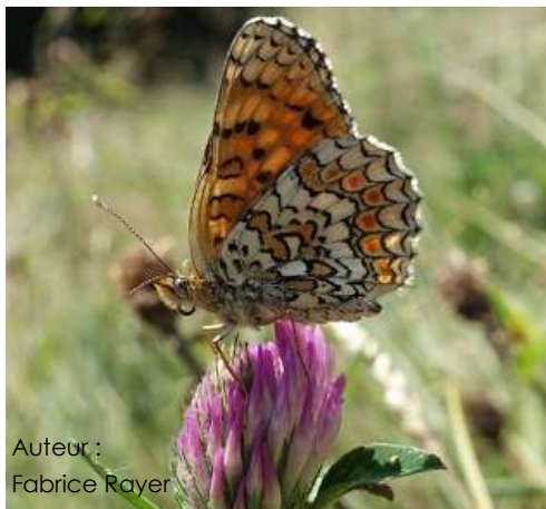
Auteur : Fabrice Rayer

La taille de cette espèce varie entre 35 et 45 mm. Il est de couleur fauve orangé clair avec des marges noires bien marquées. Le dessous des ailes antérieures est orange à damier jaune clair avec des bandes rouge orangé. Le dessous des ailes postérieures est blanc avec deux bandes couleur fauve, l'une d'elle a de gros points orange vif en son centre.