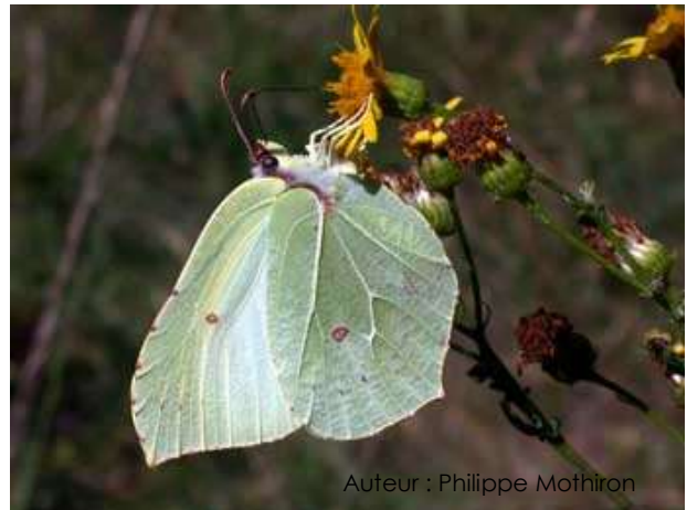
Auteur : Philippe Mothiron