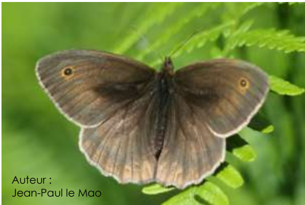
Auteur : Jean-Paul le Mao