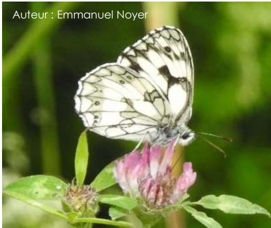
Auteur : Emmanuel Noyer

Ce papillon mesure entre 30 et 50 mm. Le dessus des ailes est blanc avec des plages noires, donnant un effet de damier. Le dessous des ailes est identique mais le noir est moins intense et il y a une série d'ocelles bruns. La femelle est un peu plus grande que le mâle et présente au niveau du dessous de ses ailes les mêmes motifs que les mâles mais sur un fond un peu plus jaunâtre.