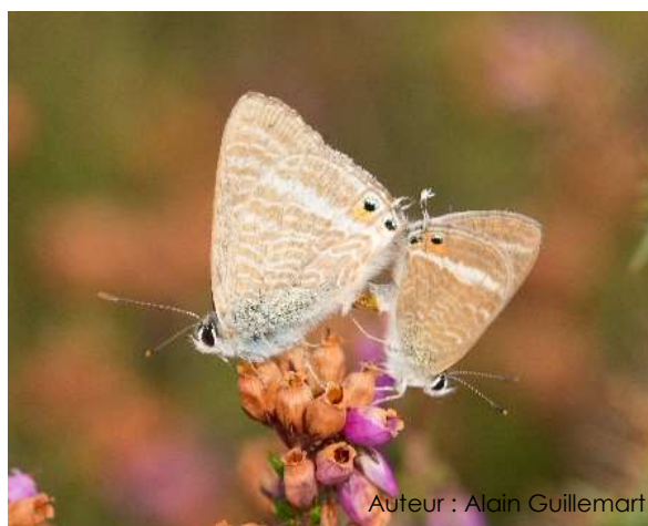
Auteur : Alain Guillemart