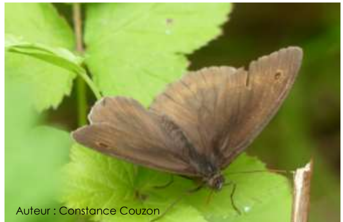
Auteur : Constance Couzon