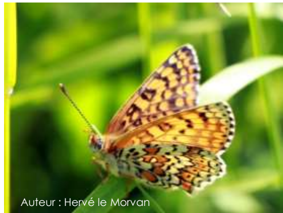
Auteur : Hervé le Morvan