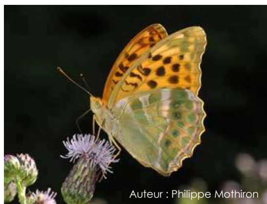
Auteur : Philippe Mothiron