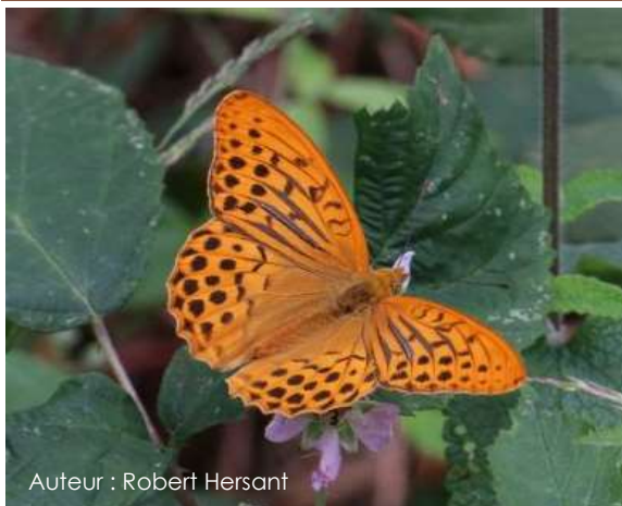
Auteur : Robert Hersant