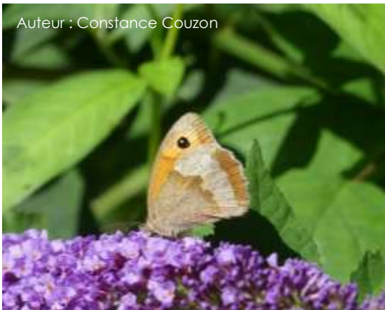
Auteur : Constance Couzon

La taille de ce papillon varie entre 45 et 55 mm, la femelle est légèrement plus grande que le mâle. Le dessus du mâle est brun sombre, la femelle est plus claire avec une large bande orangée sur les ailes antérieures. De chaque côté des ailes antérieures, on retrouve un ocelle noir pupillé de blanc. Le dessous des ailes antérieures est orangé, tandis que celui des ailes postérieures est brun clair avec une bande blanchâtre bien nette chez les femelles.