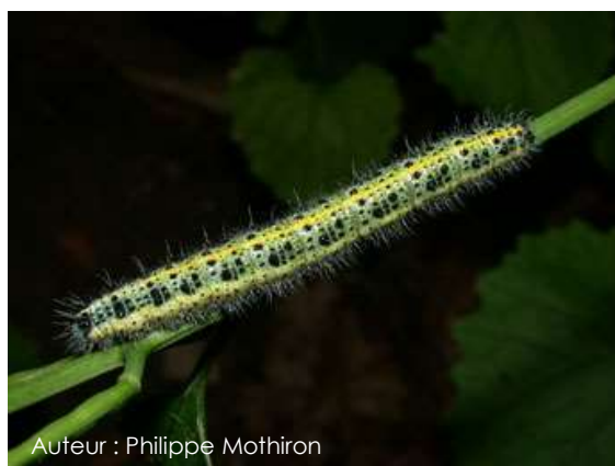
Auteur : Philippe Mothiron

La chenille est vert-jaune avec des petits points et des taches noires, ainsi que de fins poils blancs.