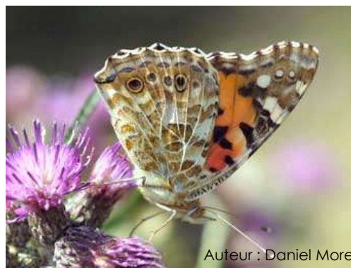
Auteur : Daniel Morel