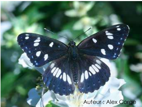
Auteur : Alex Corge

Il mesure entre 45 et 50 mm. Le dessus de ses ailes est noir bleuté avec une épaisse rangée de taches blanches. Le dessous des ailes est brun-rouge avec une rangée de taches blanches et des taches grises à la base.