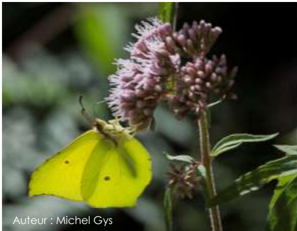
Auteur : Michel Gys

Son envergure se situe entre 50 et 55 mm. Le dessus des ailes chez le mâle est jaune vif, tandis qu'il est blanc-verdâtre chez la femelle. Chacun d'eux porte un petit point orange sur chacune des ailes. Le revers des ailes est plus terne avec un point brun sur chacune d'elles. La forme des ailes est caractéristique : elles sont légèrement pointues à leur extrémité.