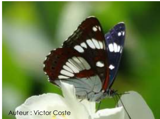
Auteur : Victor Coste