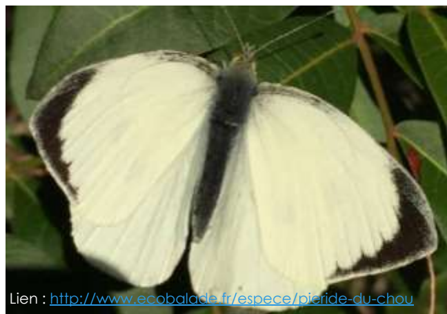
Lien : http://www.ecobalade.fr/espece/pieride-du-chou