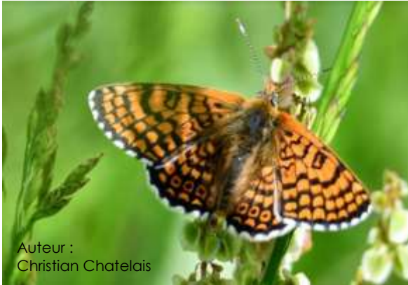
Auteur : Christian Chatelais