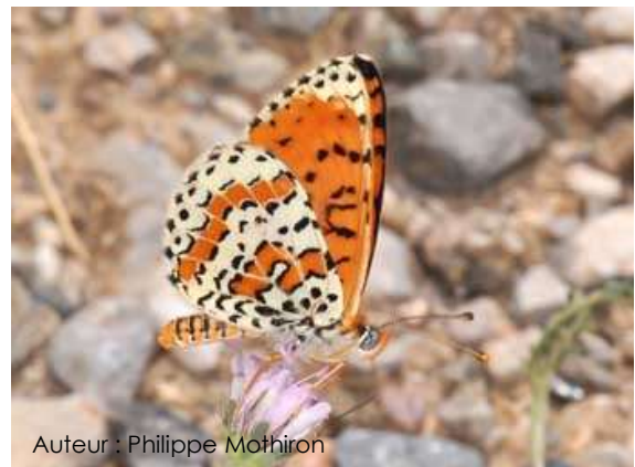
Auteur : Philippe Mothiron