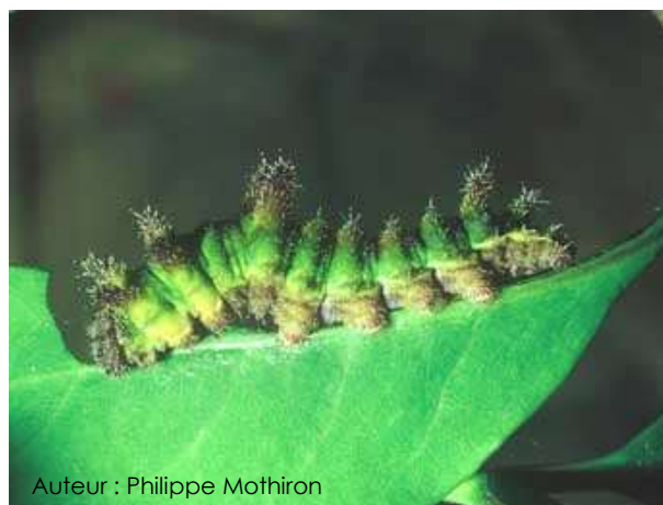
Auteur : Philippe Mothiron

Elle mesure entre 20 et 25 mm au dernier stade. Elle est de couleur verte avec des reflets bruns, sa face ventrale est brun-rougâtre de même que ses épines.