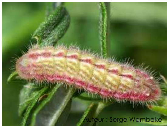
Auteur : Serge Wambeke

La chenille est petite, elle a une tête noire et un corps vert avec des lignes pourpres.