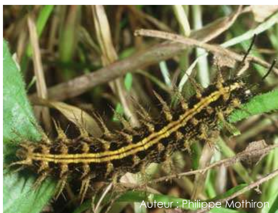
Auteur : Philippe Mothiron

Elle est brun foncé et possède deux lignes dorsales jaunes ainsi que des épines jaune orangé.