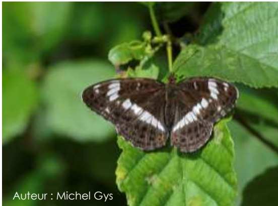
Auteur : Michel Gys