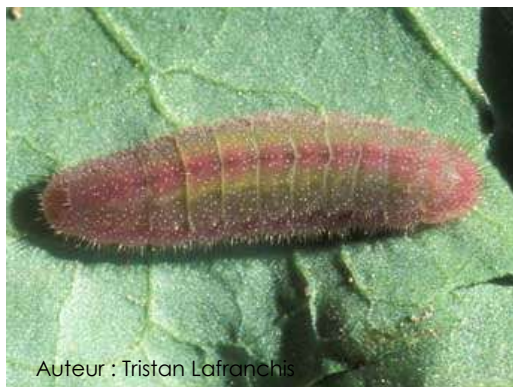
Auteur : Tristan Lafranchis

Elle mesure environ 15 mm au dernier stade. Elle est verte, légèrement poilue, avec des lignes dorsales et latérales pourpre (parfois absente). Elle est difficilement identifiable.