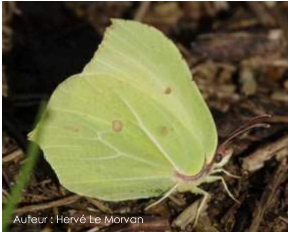
Auteur : Hervé Le Morvan