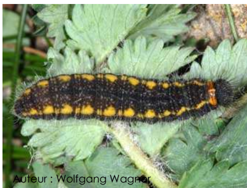
Auteur : Wolfgang Wagner

La chenille est noire, recouverte de poils fins et elle possède deux lignes jaunes sur le dos.