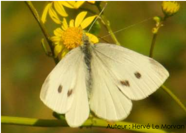
Auteur : Hervé Le Morvan

Son envergure varie entre 40 et 50 mm. Le dessus des ailes est blanc avec une tache noire à l'extrémité de l'aile antérieure chez le mâle et deux chez la femelle. Le dessous des ailes est jaunâtre.