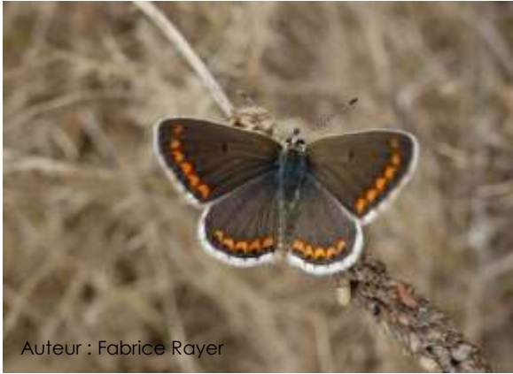
Auteur : Fabrice Rayer