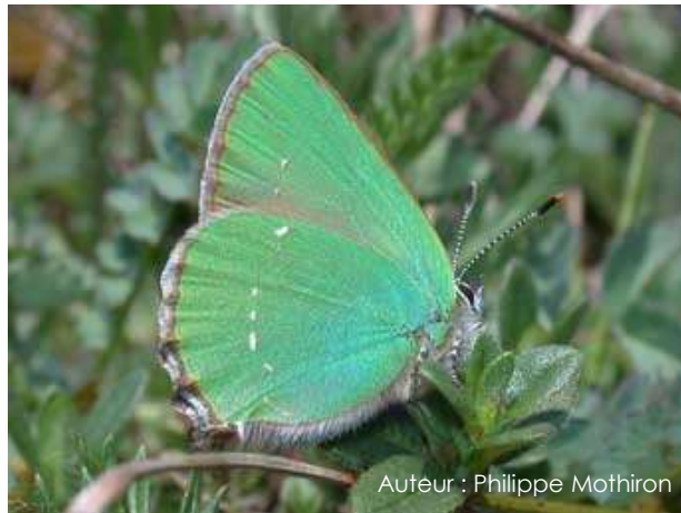
Auteur : Philippe Mothiron

Son envergure varie entre 20 et 30 mm. Le dessus des ailes est brun uniforme, il est rare de le voir car lorsque le papillon est au repos ses ailes sont fermées. Le dessous des ailes est vert avec une ligne de petits points blancs, parfois sur les quatre ailes, mais la plupart du temps uniquement sur les ailes postérieures.