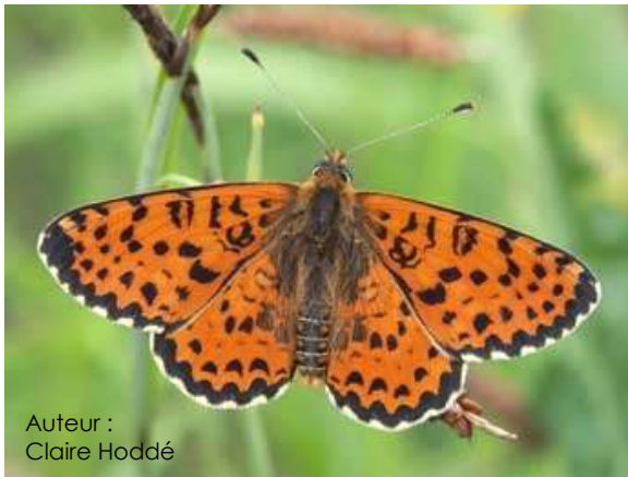
Auteur : Claire Hoddé