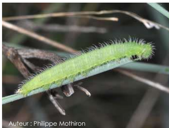
Auteur : Philippe Mothiron

La chenille mesure environ 20-25 mm au dernier stade. Elle est verte, recouverte de poils fins et porte un appendice en forme de fourche à l'arrière.