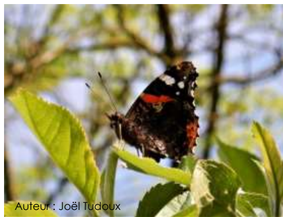
Auteur : Joël Tudoux