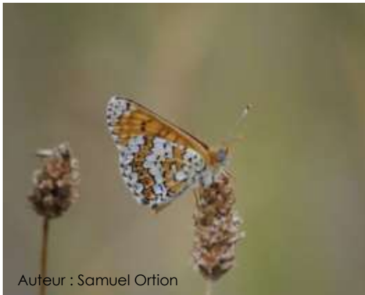
Auteur : Samuel Ortion

La taille de l'adulte est comprise entre 30 et 40 mm. Ce papillon est de couleur fauve orangé clair avec des rangées rouge orangé bordées de noir. Le dessous de l'aile postérieure est blanc avec des bandes orangées et des rangées de points noirs. Le dessous des ailes antérieures est fauve orangé avec quelques points noirs et des nuances de jaune voire blanc aux extrémités. La présence de points noirs dans la bande submarginale orange de l'aile postérieure, visible sur les deux faces , est caractéristique de l'espèce.