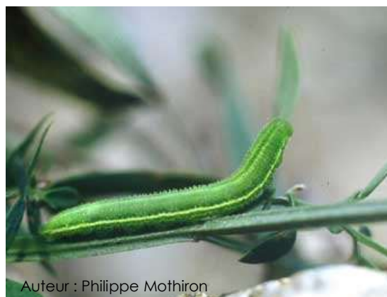
Auteur : Philippe Mothiron

La chenille est verte avec une bande jaune sur le côté.